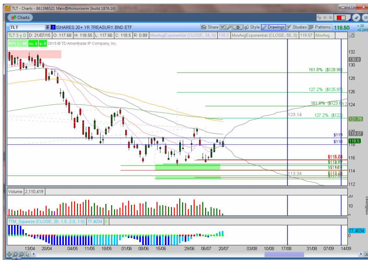
Bild 3: Symmetrie- und Fibonacci-Unterstützungszonen im TLT (grüne Clusters), die eine bullische Marktentwicklung in den nächsten Wochen favorisieren. Das Trippel-Tief gibt ein weiteres Indiz für eine mögliche bevorstehende Rally. Die nächsten Fibonacci Extensions-Ziele lägen bei dann bei 122 und 124. Der graue Wahrscheinlichkeits-Konus (1 Standard Abweichung) im Chart zeigt, dass die Ziele 122/124 bis zum Verfall am 20. August 2015 mit 68 prozentiger Wahrscheinlichkeit erreichbar sind.